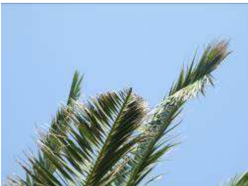
Fig. 3 Margini seghettati e rosure fogliari

I primi sintomi riscontrabili sulle palme sono l'asimmetria della chioma e la presenza di foglie spezzate o con margini seghettati.