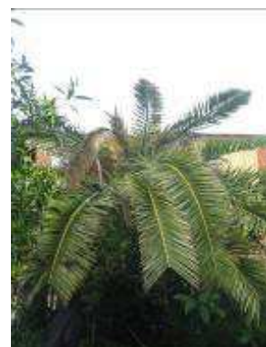
Fig. 4 Asimmetria della chioma e appiattimento