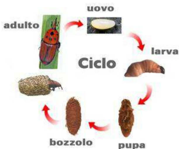
Fig. 2 Ciclo biologico del punteruolo

L'adulto del punteruolo presenta un colore rosso ferrugineo, da cui deriva il nome. Sulla parte superiore del torace sono evidenti striature nere di numero e forma variabili. La lunghezza dell'adulto può variare tra i 3 ed i 5 cm e la larghezza da 1 a 1,5 cm. Il capo è caratterizzato dalla presenza di un lungo rostro, su cui sono inserite 2 antenne e all'estremità del quale è presente l'apparato boccale. Nei maschi esso è lungo circa 1 cm ed è munito di una serie di fitte setole erette, mentre nelle femmine è privo di setole e leggermente più lungo ed arcuato.