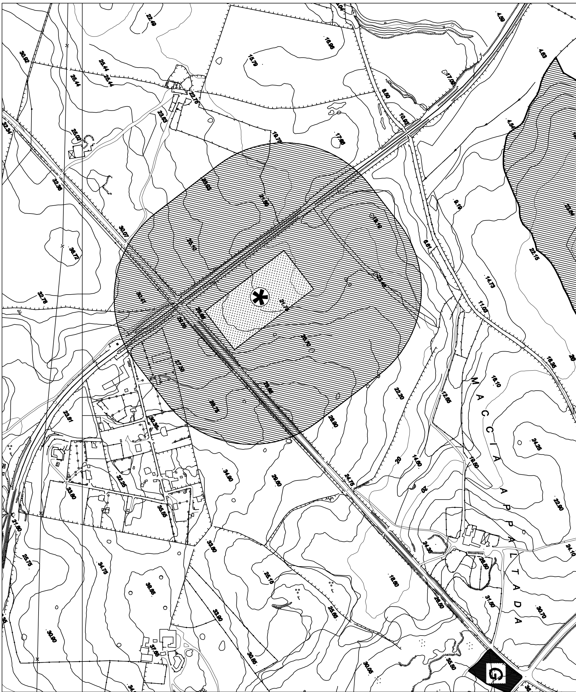
STRALCIO VARIANTE P.R.G. scala 1:4000

----- Limite zona P.R.G. Limite cimitero - - - - - Limite area d'intervento: 1° stralcio 3 fase 1° lotto