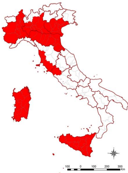
Figura 1. Aree classificate come endemiche (in rosso) per il virus della West Nile

B Resto del territorio nazionale. In queste aree le attività di sorveglianza prevedono il monitoraggio sierologico a campione su sieri di cavalli per rilevare la presenza di IgM, utili all'identificazione di una